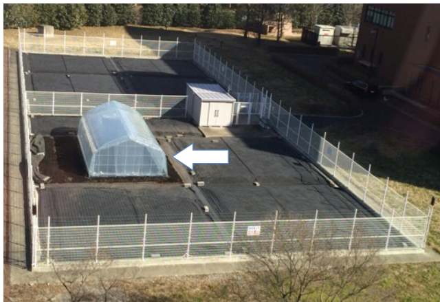
隔離ほ場内のビニール温室 (矢印)

遺伝子組換えにより完全八重咲き化した、雌ずい花弁化八重咲きシクラメンの2系統、及び、その親系統となる非遺伝子組換えシクラメンの第一種栽培試験を4月24日に開始しました。隔離ほ場内に設置したビニール温室内の架台に、鉢植えとして栽培しています。ビニール温室には防鳥網を施してあります。栽培試験・環境影響評価試験等を行っています。