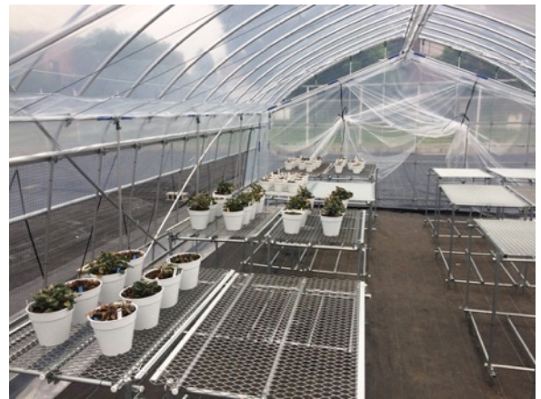
ビニール温室内部 (架台と鉢植え)